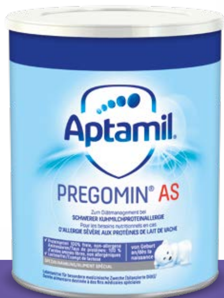
Im 1. Lebensjahr Aptamil Pregomin AS