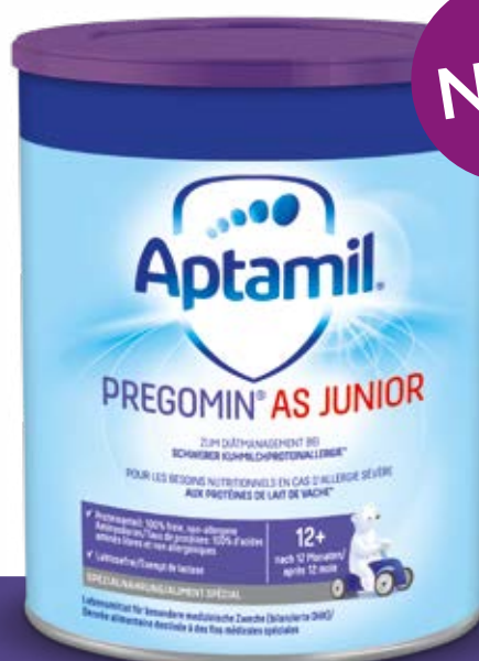
Nach dem 1. Lebensjahr Aptamil Pregomin AS Junior